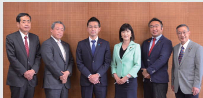
▲今期の区議団役員

4月に会派役員の改選が行われ、私は自民党世田谷区議団の幹事長を務めることとなりました。重責ではありますが、区議会第一会派のまとめ役として、役員のサポートも得ながらしっかりと務めて参ります。