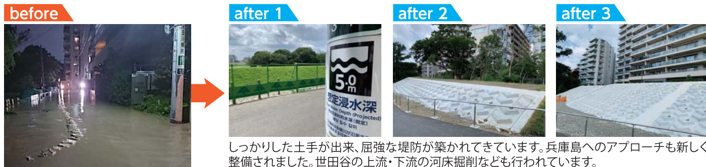
しっかりした土手が出来、屈強な堤防が築かれてきています。兵庫島へのアプローチも新しく整備されました。世田谷の上流・下流の河床掘削なども行われています。

愛車・オギケン号で区内の現場を見てきた様子をレポート。2019年10月の台風19号で多摩川から溢水してしまった二子玉川・兵庫橋付近の無堤防区間ですが、その後、国交省・京浜河川事務所による工事が始まりました。現在2期工事が進行中で、2024年3月末の完成に向けて着々と工事が進んでいます。