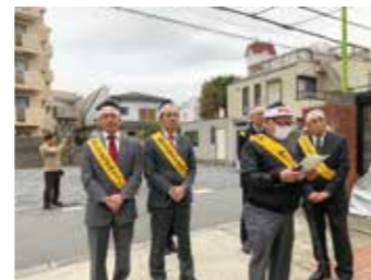
▲団体の入る施設前で抗議文を読み上げ