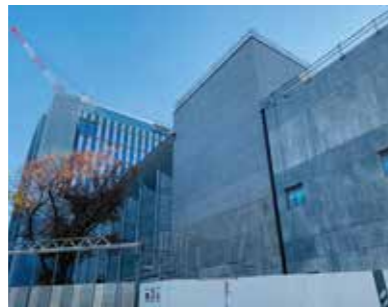
▲旧区民会館の外壁工事も進んでいる