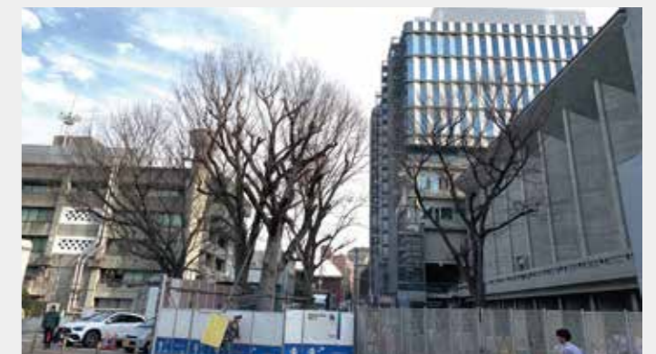
▲本来ならば1期工事は昨年7月に完了していた

昨今の物価高・資源高騰等の影響ではなく、単純な工期見誤りにより、1期工事は当初の10ヶ月、全体では2年近く工期延長が示されました。公共工事では前代未聞の延期幅であり、施工主である大成建設に対し違約金を求めるなどの対応も始まっています。