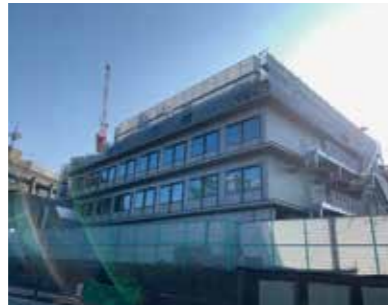
▲北側から見た工事現場。現第2・第3庁舎は一体化される