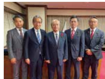
▲小泉法務大臣を囲んで

烏山地域にて、 オウム真理教の後継団体「ひかりの輪」 が拠点を構え、未だ活動を続けています。区議会でも特別委員会で長年テーマとして取り扱っています。昨年10月には住民協議会の皆さんと法務大臣と公安調査庁長官に対し、 観察処分の延長を求める要請行動 に。また11月には烏山での抗議デモにも参加しました。事件を風化させず、一日も早い解決に向け私も尽力します。