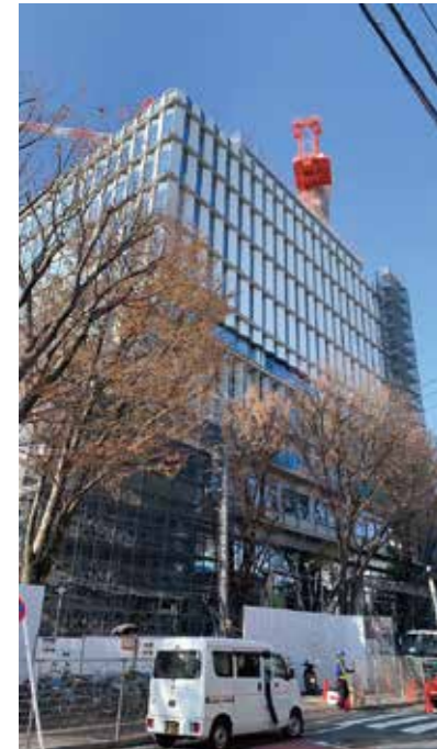
▲1期工事で完成する東棟。議会棟も入る