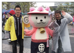
用賀屋台村にて「よっきー」と