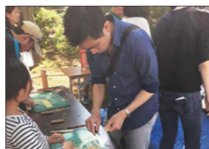
児童館の子ども祭りでお手伝い