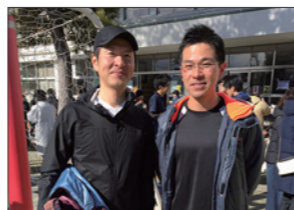
上野毛地区新春マラソンに初参加！