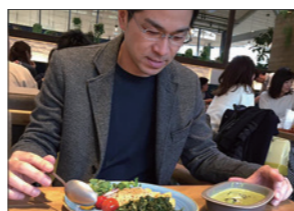
駒沢公園にできたレストランにて