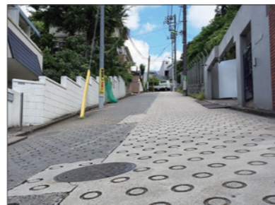
国分寺産線沿いは急坂が多く、高齢者には負担大

▶ 交通政策課長 他都市では自治体が自主運行する方法や運行を委託する方法のほか、病院の送迎バスの空席を利用させてもらう事例などがある。地元の意向などを確認しつつ、地域の状況に適した対策を見出していくことが必要であると考えている。