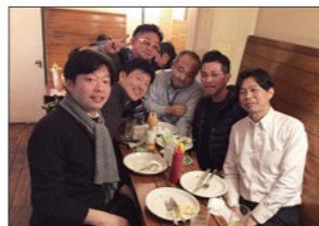
上野毛の「街バル」を楽しみました