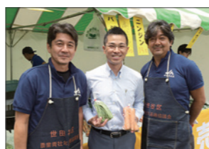
JA品評会にて地元の先輩方と